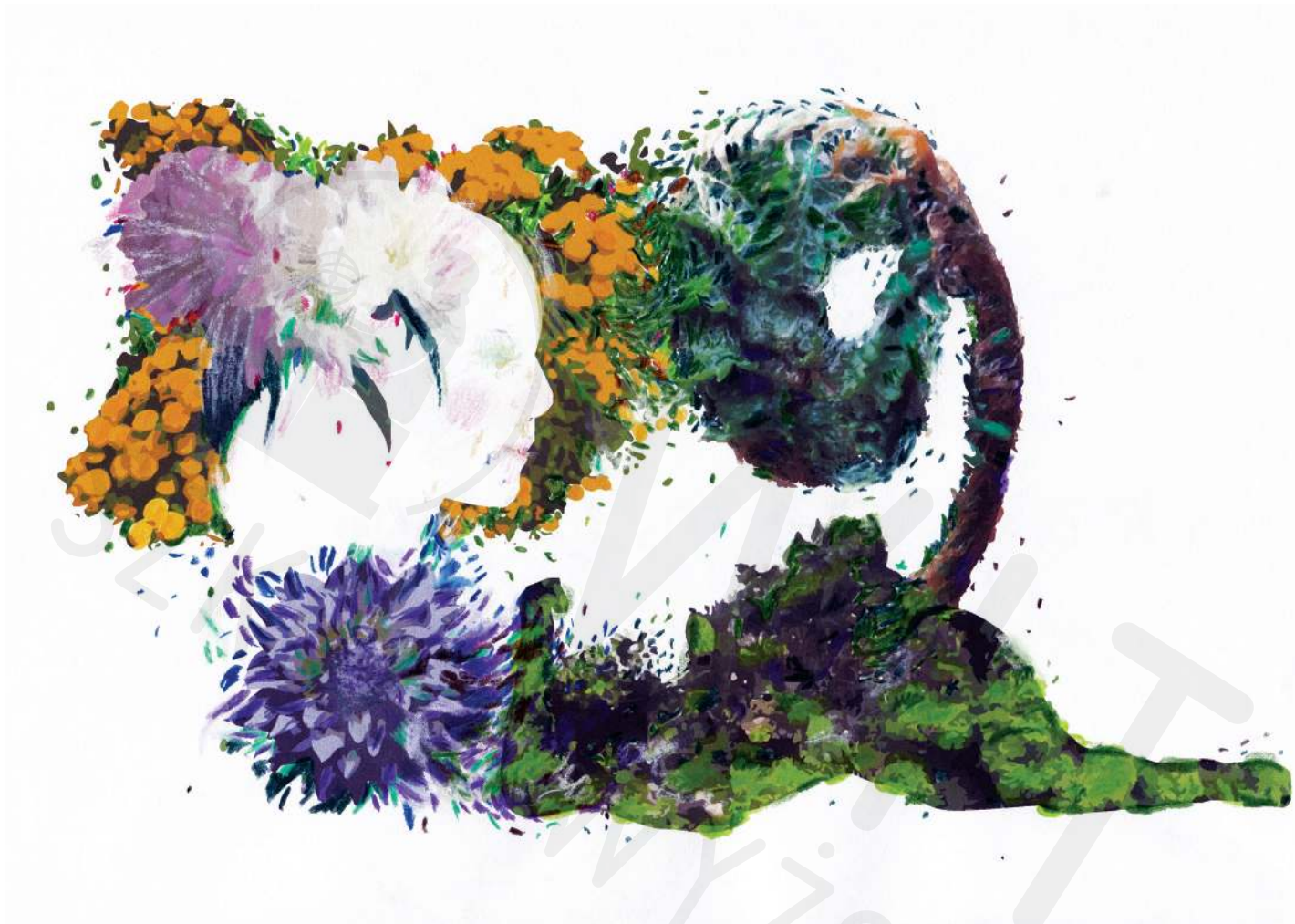
Madonna grafika cyfrowa, ilustracja technika mix-media druk cyfrowy na papierze, kredka

Madonna digital graphics, illustration mix-media technic digital printing on paper, colored pencil 2020/2021 21x 29,5 cm