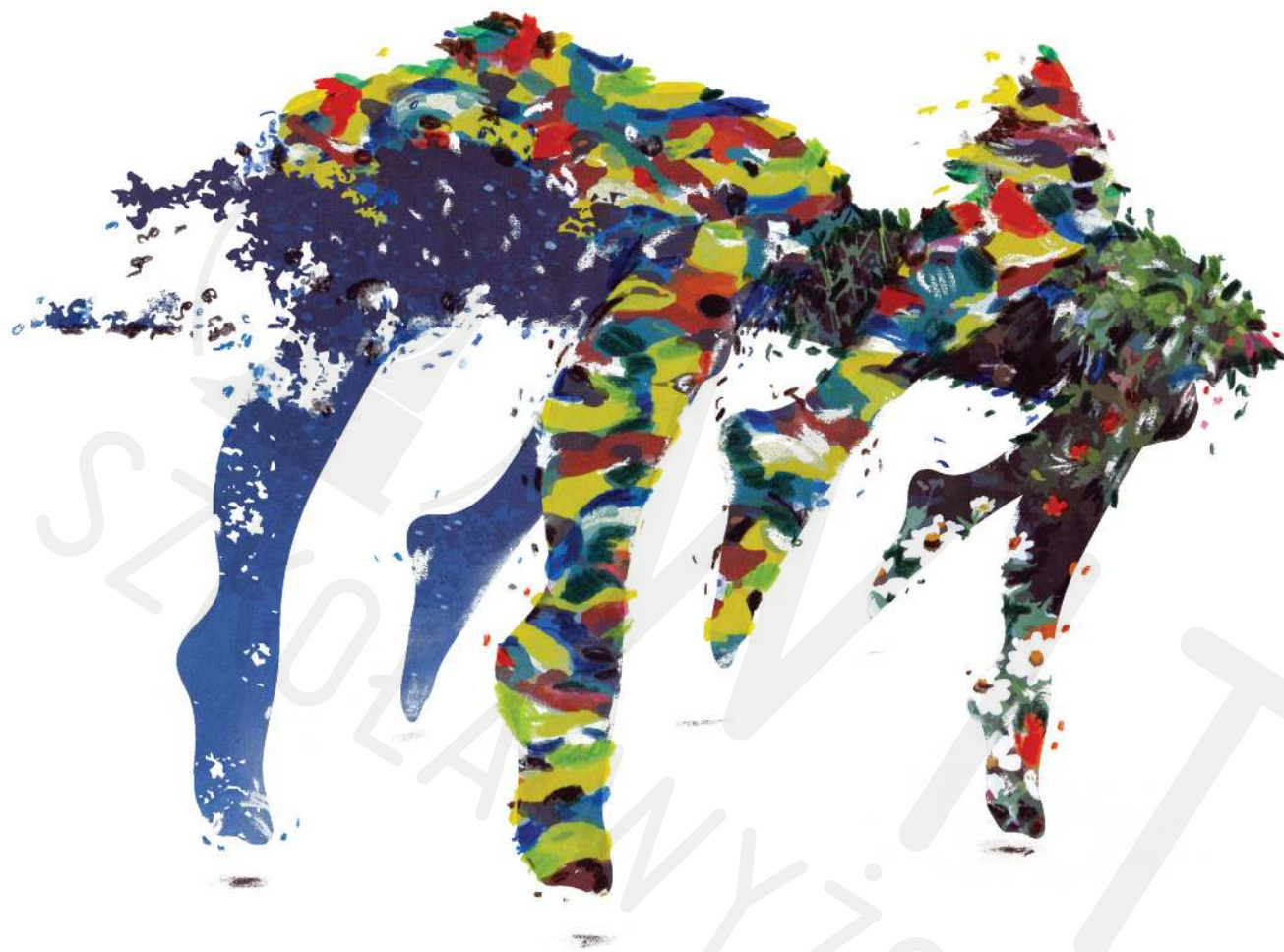
Bosa grafika cyfrowa, ilustracja technika mix-media druk cyfrowy na papierze, kredka

Barefooted digital graphics, illustration mix-media technic digital printing on paper, colored pencil 2020/2021 21x 29,5 cm