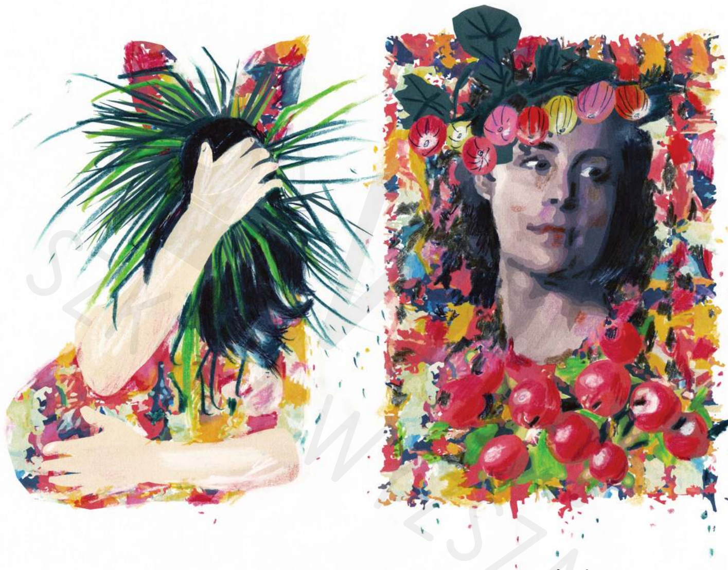
Agrestowa grafika cyfrowa, ilustracja technika mix-media druk cyfrowy na papierze, kredka

Gooseberryly digital graphics, illustration mix-media technic digital printing on paper, colored pencil 2020/2021 21x 29,5 cm