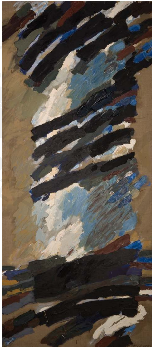
Wzrastające olej na płótnie Rising oil on canvas 220 x 100 cm 1985