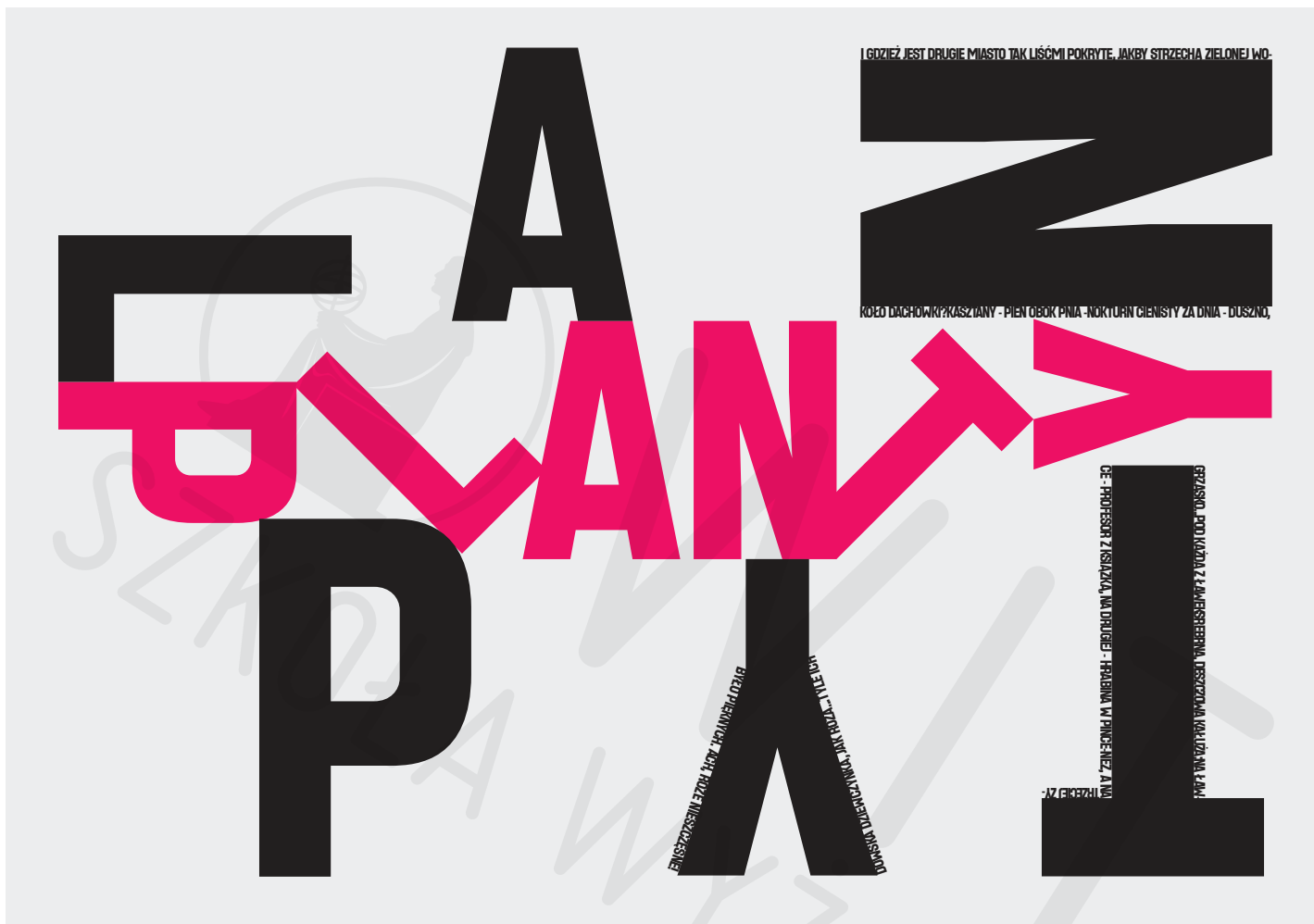
Planty druk pigmentowy Park pigment printing, 100x70cm 2021