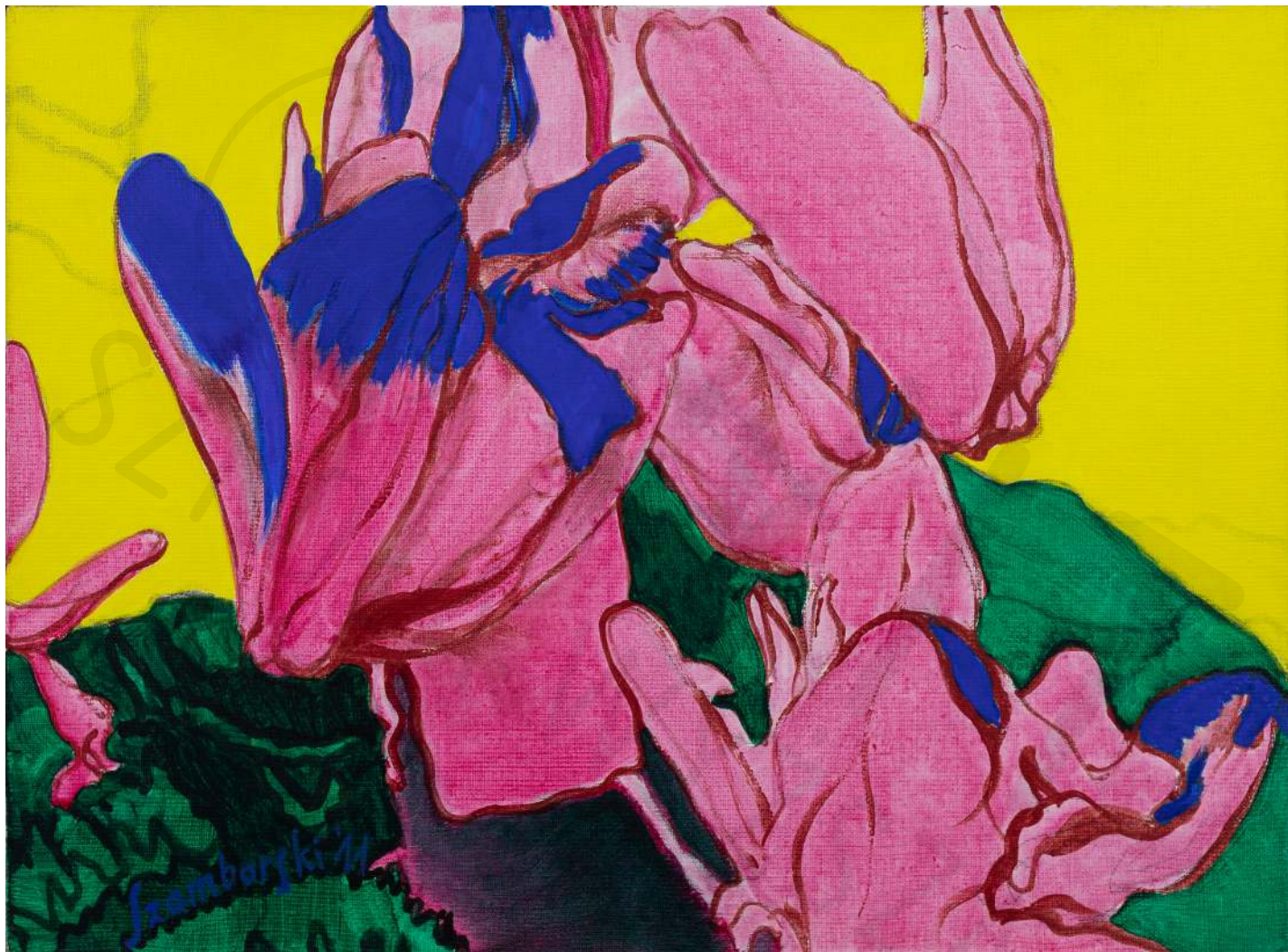
Fiołki w słońcu niebieskim (małe)