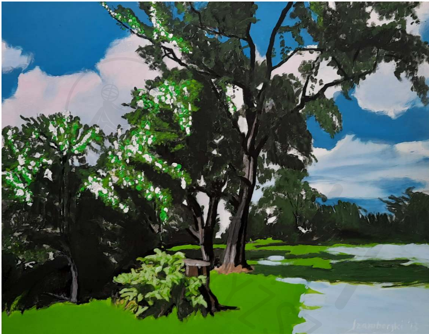
Pod drzewem plótno, akryl Under the tree canvas, acrylic 70 x 90 cm 2013