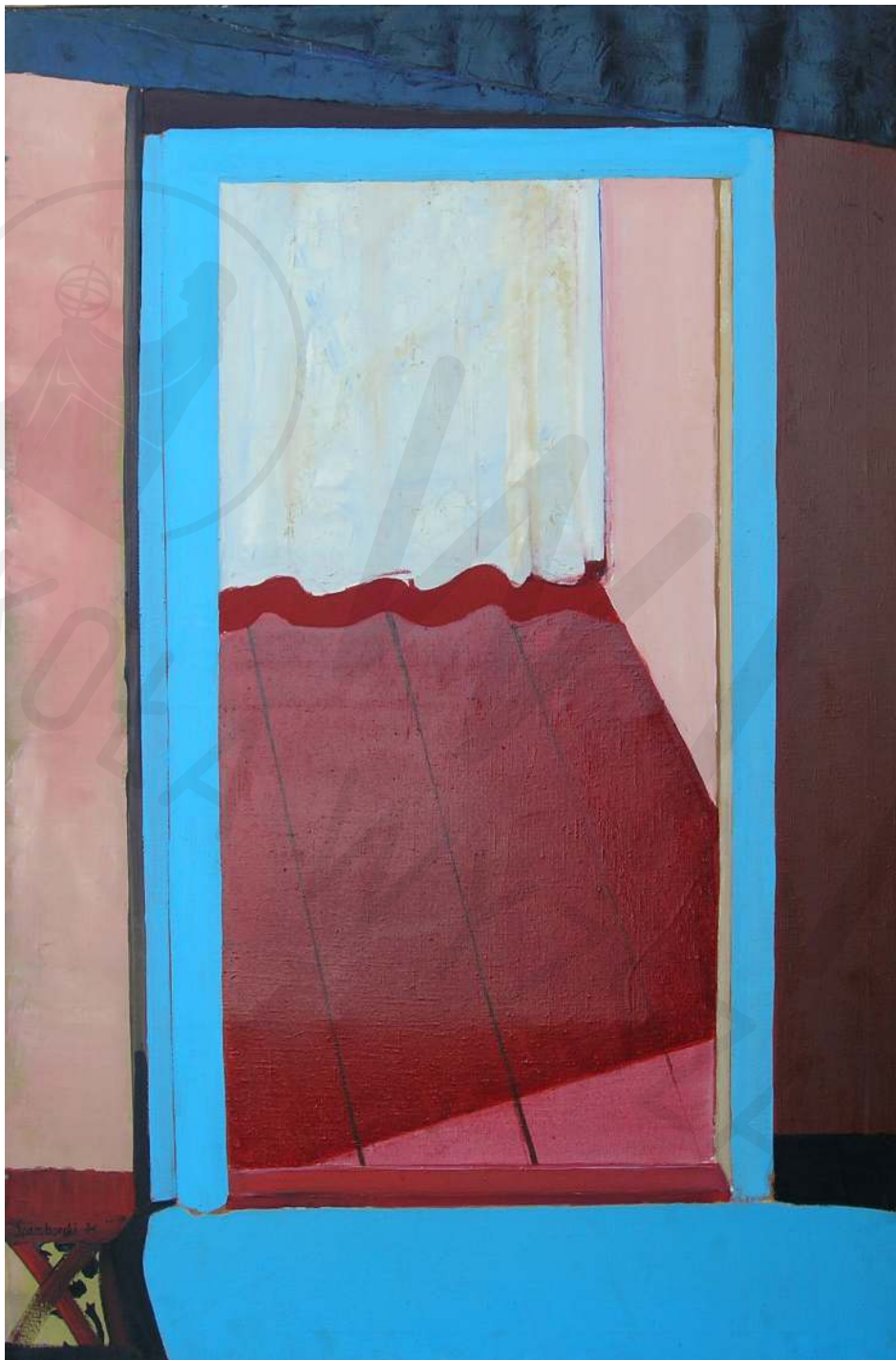
Otwarte plótno, olej Open canvas, oil 146 x 97 cm 1971